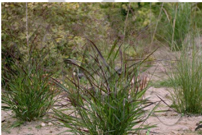
Panicum virgatum 'Squaw'

Kolorystyka liści poszczególnych odmian obejmuje paletę różnych odcieni zieleni i niebieskości czy też szarości. Jesienią, a niekiedy już późnym latem, rośliny zaczynają zmieniać barwy.