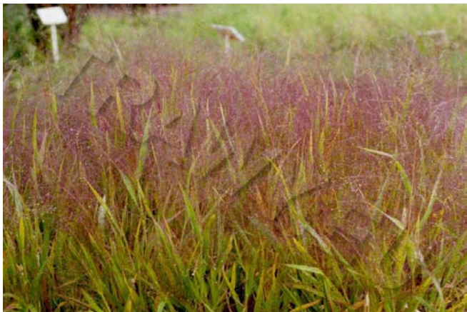
Panicum miliaceum 'Violaceum'

Prosa jednoroczne mają w ogrodnictwie ozdobnym znaczenie marginalne, niemniej warto wspomnieć o dwóch gatunkach.