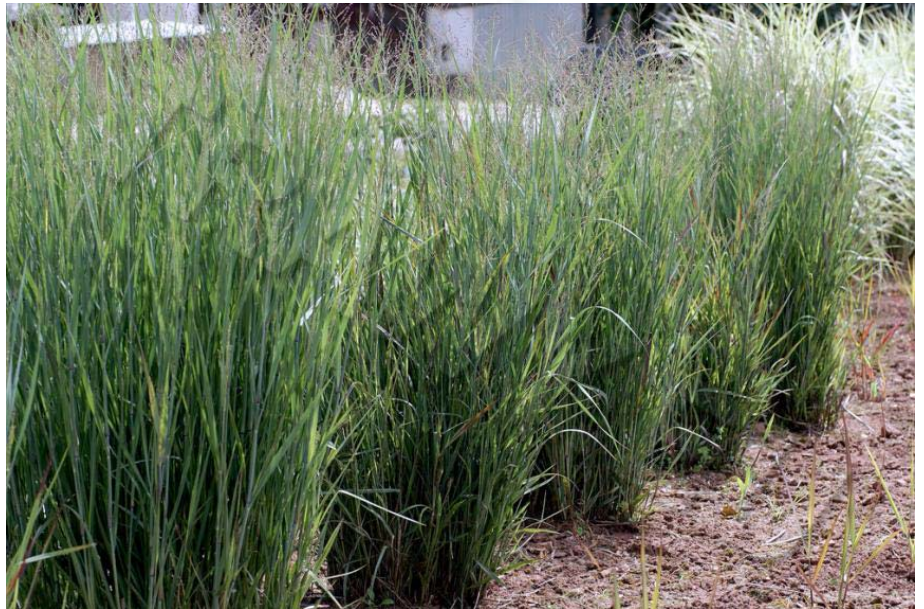
Panicum virgatum 'Heavy Metal'

Zielonolistne proso zmieniając kolor przybierają różne odcienie, ale raczej choć częściowo czerwienieją. Wyjątki to np. 'North Wind' , która żółknie czy 'Kupferhirse' , która przechodzi w pomarańcz. „Czerwienienie” - bardzo ceniona cecha - stała się wyznacznikiem wielu odmian.