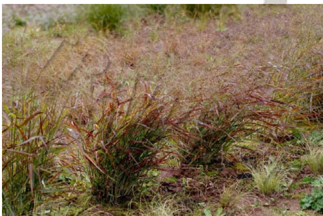
Panicum virgatum 'Rotstrahlbusch'

Małe, nie przekraczające metra to np. 'Campfire' i prawie 2-metrowe, np. 'Warrior' . Dość często można spotkać rośliny z nazwą 'Rubrum' – to zbiorcze określenie wielu czerwonolistnych odmian.