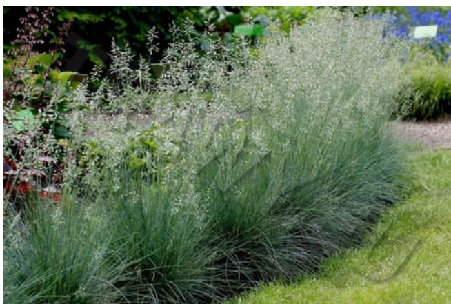
Festuca glauca 'Blauglut'

• 'Festina' - jedna z nowszych odmian, zielono-niebieska.