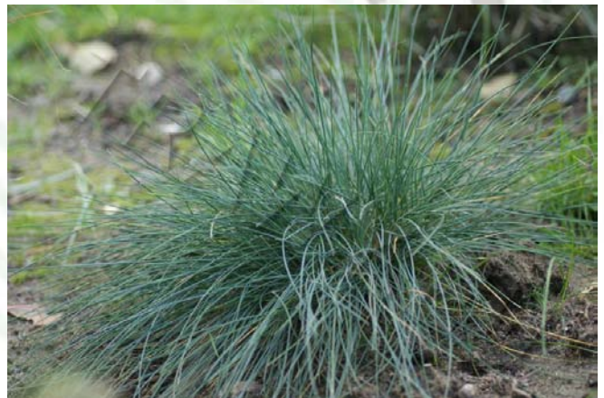
Festuca glauca 'Harz'

Rodzima kostrzewa, z niebieskawymi odmianami to kostrzewa owcza ( Festuca ovina ), choć ja ją osobiście lubię w czystej zielonolistnej postaci.