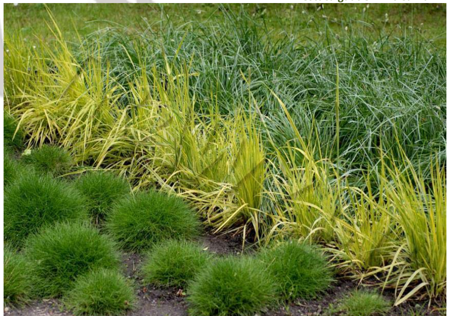
Festuca gautieri 'Pic Carlit'

Z występujących dziko w Polsce gatunków chciałbym jeszcze wspomnieć o kostrzewa blada ( Festuca pallens ) o bladoniebieskiej kolorystyce. Rzadko uprawiana, choć podejrzewam, że część roślin sprzedawanych jako Festuca glauca (bezodmianowa) jest właśnie tą rośliną.