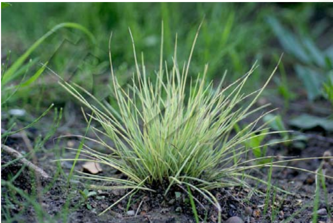
Festuca glauca 'Golden Toupee'

Wymienię jeszcze jeden kultywar, tym razem o żółtawym zabarwieniu liści, zwłaszcza wiosną - 'Golden Toupee' - często mylona z wszechobecną żółtą odmianą śmiełka pogiętego ( Deschampsia flexuosa 'Aurea').