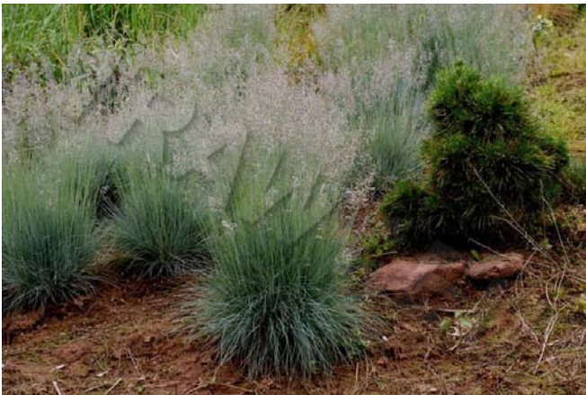
Festuca glauca 'Elijah Blue'

Wymienię jeszcze jeden kultywar, tym razem o żółtawym zabarwieniu liści, zwłaszcza wiosną - 'Golden Toupee' - często mylona z wszechobecną żółtą odmianą śmiełka pogiętego ( Deschampsia flexuosa 'Aurea').